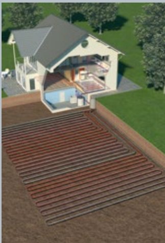
Erdwärmenutzung mit Erdregister

schutzmittel. Dieses Gemisch wird Sole genannt, daher auch der Name Sole-Wasser Wärmepumpen. Die Wärmepumpe bringt die entnommene Wärmeenergie auf die Temperatur, Vorlauftemperatur genannt, die für das Heizen des Hauses notwendig ist. Da hierfür zusätzlich Strom benötigt wird, gilt: Je tiefer die Vorlauftemperatur, desto höher die Energieeffizienz.