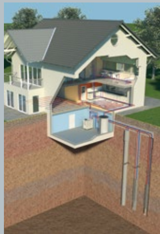
Erdwärmenutzung mit Sonden