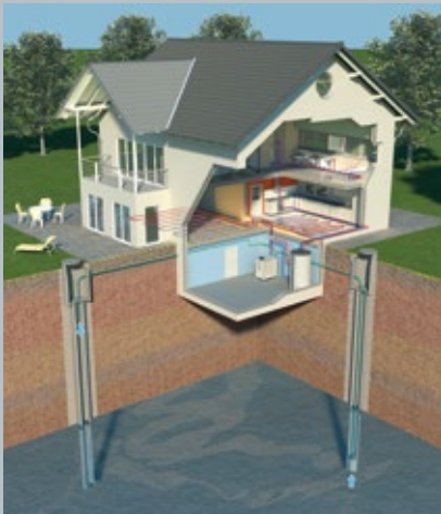
Energiegewinnung aus Grundwasser

AQUATOP T Wärmepumpen zeichnen sich durch Qualität und Zuverlässigkeit aus. Verarbeitet werden ausschließlich hochwertige Materialien. AQUATOP T Wärmepumpen erfüllen die strengen europäischen Qualitätsnormen und besitzen das internationale Wärmepumpen-Gütesiegel. Dieses umfasst nicht nur die Qualität des Produktes, sondern auch die Verlässlichkeit der Serviceorganisation.